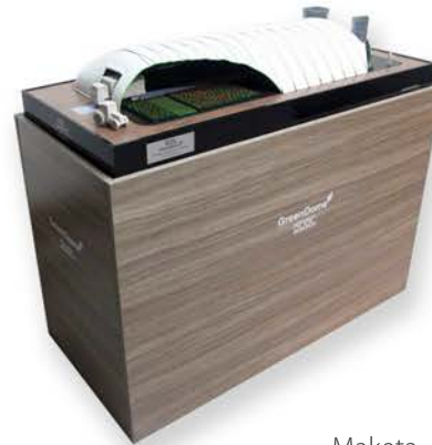
Maketa DUOL GreenDome Dimenzije: 120 x 70 cm Merilo 1:50

Prav tako poskrbimo tudi za razne napise, podstavke in pleksi pokrov ter ostale vaše želje.